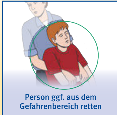
Person ggf. aus dem Gefahrenbereich retten