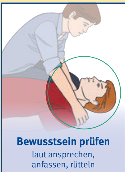
Bewusstsein prüfen laut ansprechen, anfassen, rütteln