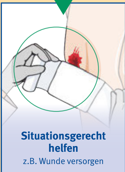
Situationsgerecht helfen z.B. Wunde versorgen